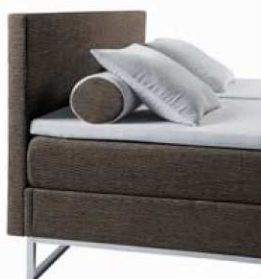
Kopfteil A - Avantgarde

Fragen Sie uns einfach telefonisch oder per Email an, oder kommen Sie in unserem Schlafcenter vorbei und lassen Sie sich von unserem fachkundigen TEMPUR-Team beraten. Wir freuen uns auf Ihren Besuch.