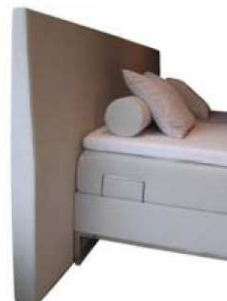
Kopfteil C - Ice Grey