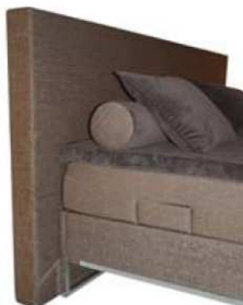
Kopfteil B - Chocolate