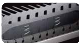
• Druckausgleich-System DAS mit Luftkissentechnik und Fiberglasfederung