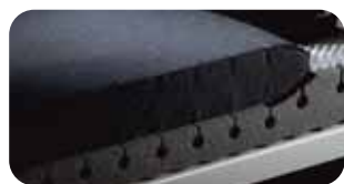
• Schulter-Balance-System SBS