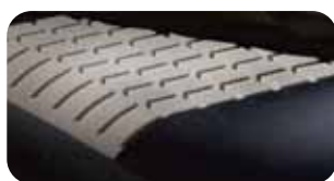
• Punktuelle Schulter-Nacken-Entspannung