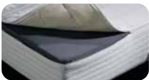
• NEU: AC-Cover abnehmbar (chemische Reinigung oder waschbar)

Art.Nr. 2033 riposa DOLCE VITA LUXE 1 (soft) Art.Nr. 2034 riposa DOLCE VITA LUXE 2 (medium) Art.Nr. 2035 riposa DOLCE VITA LUXE 3 (forte)