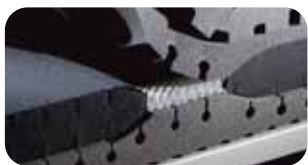
• Swiss HighTech Channel-Air • Konzept SHC