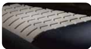
• Punktuelle Schulter-Nacken-Entspannung