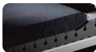
• Schulter-Balance-System SBS