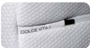
• Neue SST-Manufaktur-Details • Neuer AC Bezug Air Condition

Art.Nr. 2025 riposa DOLCE VITA 1 (soft) Art.Nr. 2026 riposa DOLCE VITA 2 (medium) Art.Nr. 2027 riposa DOLCE VITA 3 (forte)