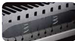
• Druckausgleich-System DAS mit Luftkissentechnik und Fiberglasfederung