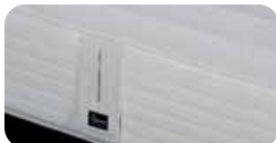
• Neue SST-Manufaktur-Details • Neuer AC Bezug Air Condition