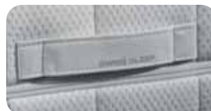
• SST-Cover-Handgriff • Neuer AC Bezug Air Condition

Art.Nr. 2061 riposa GRANDESSA 1 (soft) Art.Nr. 2062 riposa GRANDESSA 2 (medium) Art.Nr. 2063 riposa GRANDESSA 3 (forte)