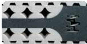
• Schulter-Balance-System SBS