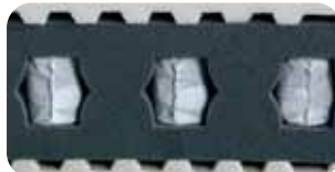
• Aktive Lendenwirbel-Stütze mit AirBoxSystem ABS