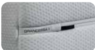
• Neue SST-Manufaktur-Details • Neuer AC Bezug Air Condition