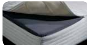
• NEU: AC-Cover abnehmbar (chemische Reinigung oder waschbar)

Art.Nr. 2064 riposa GRANDESSA LUXE 1 (soft) Art.Nr. 2065 riposa GRANDESSA LUXE 2 (medium) Art.Nr. 2066 riposa GRANDESSA LUXE 3 (forte)