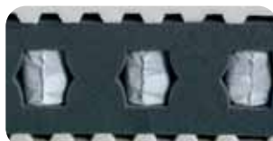
• Aktive Lendenwirbel-Stütze mit AirBoxSystem ABS