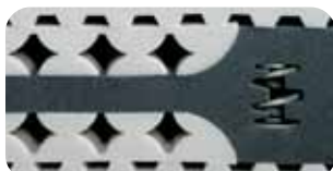
• Schulter-Balance-System SBS