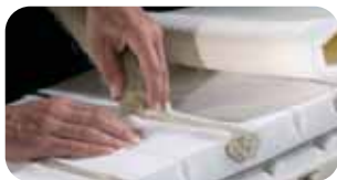
• riposa Manufaktur Rosshaar-Latex-Manufaktur (ROLMA)