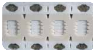
• Aktive Schaum-Box-Federung (ABS luxe)