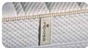
• Bezug OPERA Oeko-Tex-Standard 100 (Näh-Detail mit Bezug, Nähatelier)

Art.Nr. 2051 riposa OPERA 1 (soft) Art.Nr. 2052 riposa OPERA 2 (medium) Art.Nr. 2053 riposa OPERA 3 (forte)