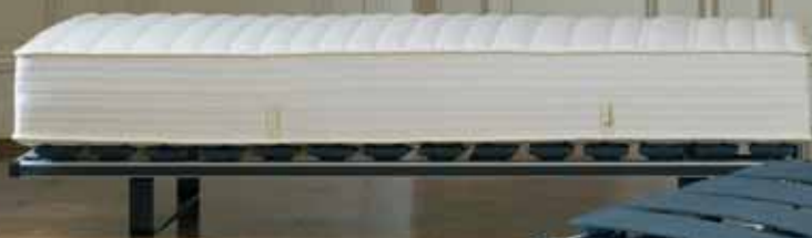
Carbon Flat Automatic System mit riposa OPERA

Das neue riposa Manufaktur-Werk im Einklang von Natur und Technik Neue riposa Rückenmatratze mit Fiberglas/Schaumfederboxen ABS luxe