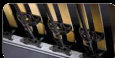
• riposa Zonenverstärkung regulierbar SST