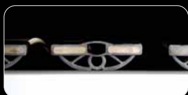
• riposa Flex-Element SST