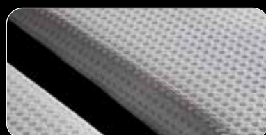
• riposa Textil-Cover