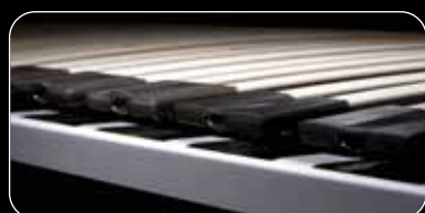
• riposa Schulter-Balance-System SBS